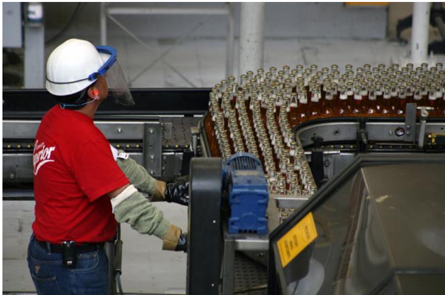
México es uno de los países que cuenta con más credibilidad en sus políticas financieras.

Archivado en: Finanzas Públicas | BM | Economía De México | Finanzas Públicas | Impreso | Valores