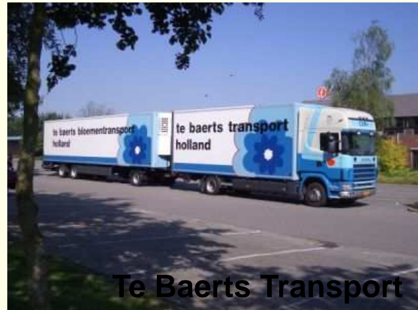
Te Baerts Transport